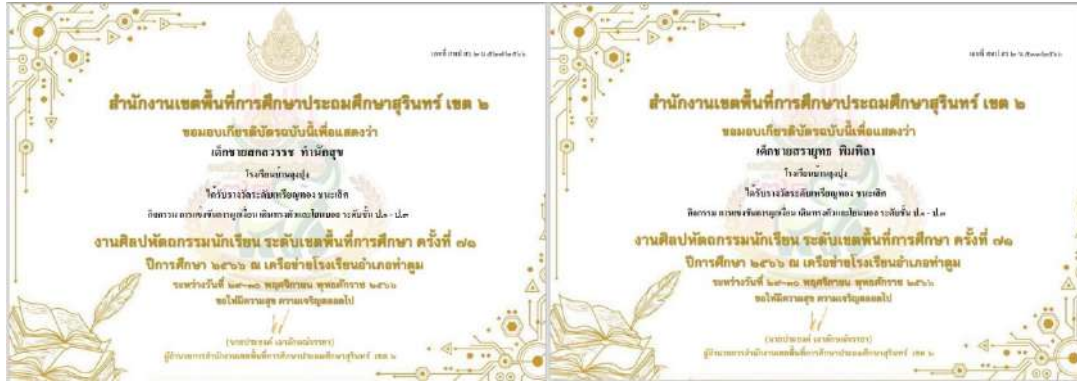
งานศิลปหัตถกรรมนักเรียนระดับเขต ครั้งที่ ๗๒ ปีการศึกษา ๒๕๖๗