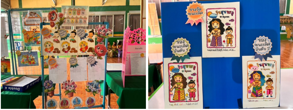
กิจกรรมแข่งขันทักษะภาษาไทยบูรณาการกิจกรรมวันภาษาไทยสู่วันสุนทรภู่