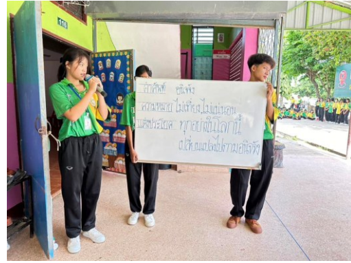
กิจกรรมภาษาไทยวันละคำ