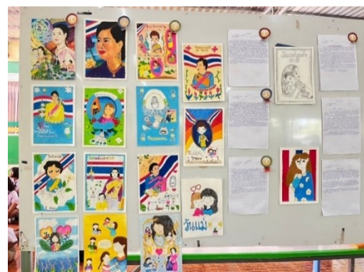
กิจกรรมแข่งขันทักษะภาษาไทยบูรณาการกิจกรรมวันแม่