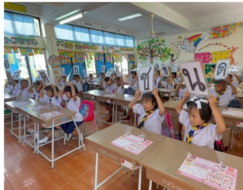
จัดโครงการรักการอ่าน กิจกรรมสอนซ่อมเสริม