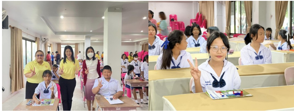
กิจกรรมการแข่งขันทักษะวิชาการทั้งในและนอกโรงเรียน