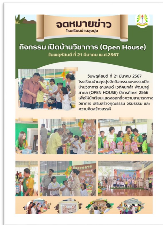
กิจกรรมมหกรรมเปิดบ้านวิชาการ ลานคนดี เวทีคนกล้า พัฒนาสู่สากล (Open House)